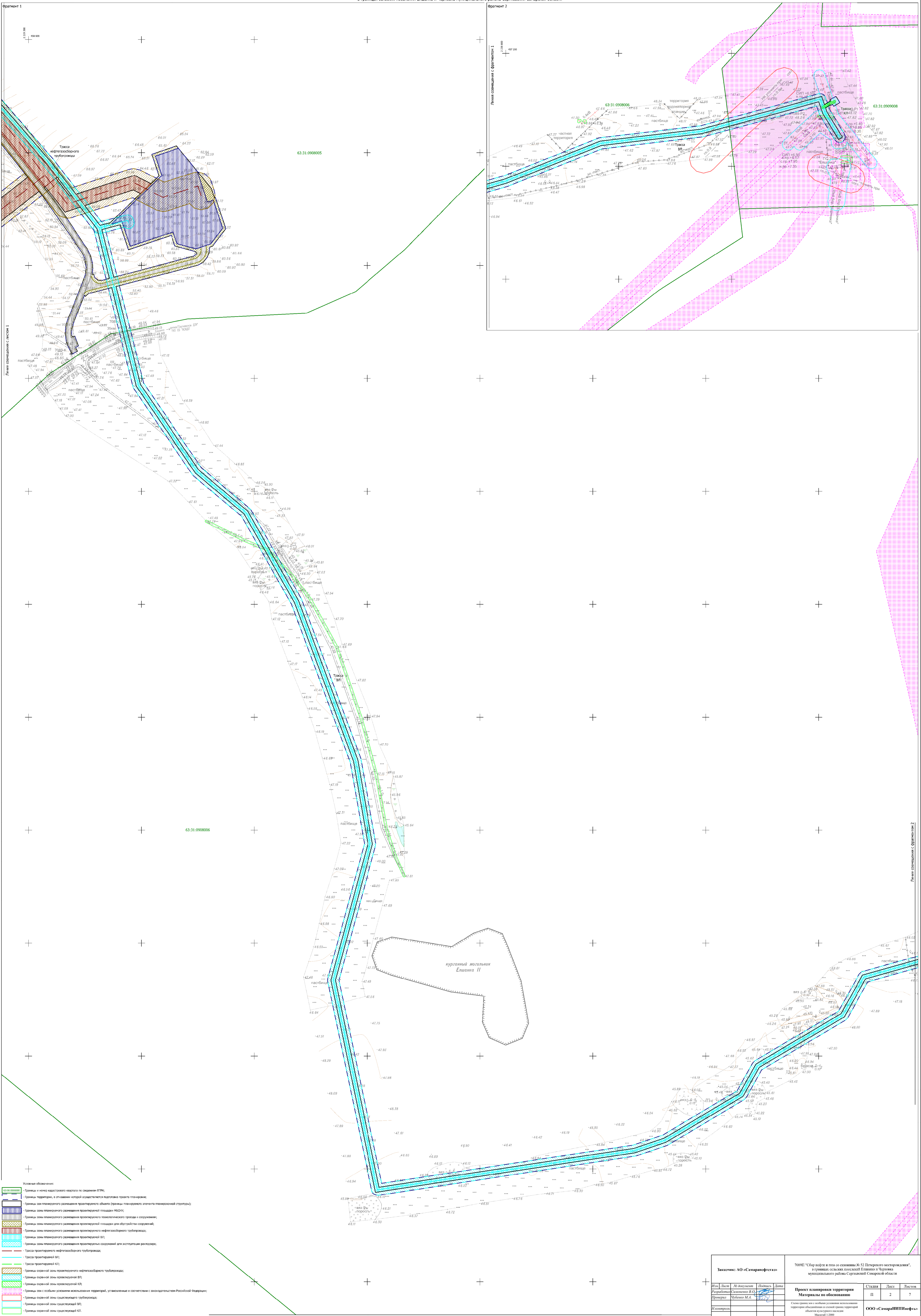
Схема границ зон с особыми условиями использования территорий объединенная со схемой границ территорий объектов культурного наследия для размещения объекта АО "СамараНефтегаз" в границах сельских поселений Елшанка и Черновка муниципального района Сергеевский Самарской области